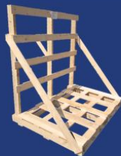
Palette à dossier